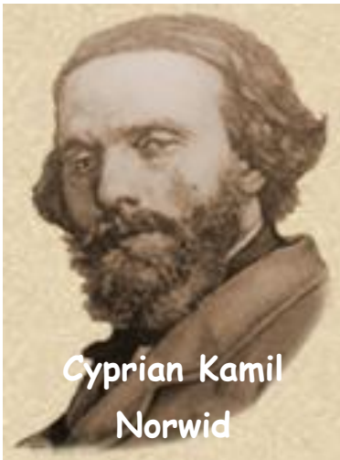
Cyprian Kamil Norwid