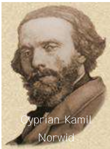
Cyprian Kamil Norwid