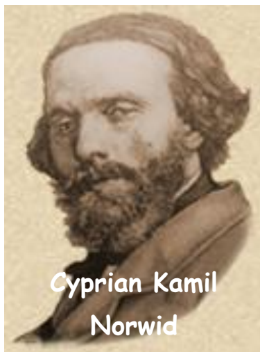
Cyprian Kamil Norwid