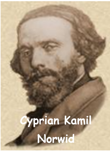
Cyprian Kamil Norwid