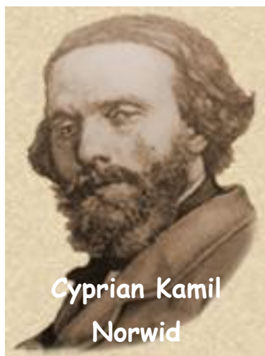
Cyprian Kamil Norwid