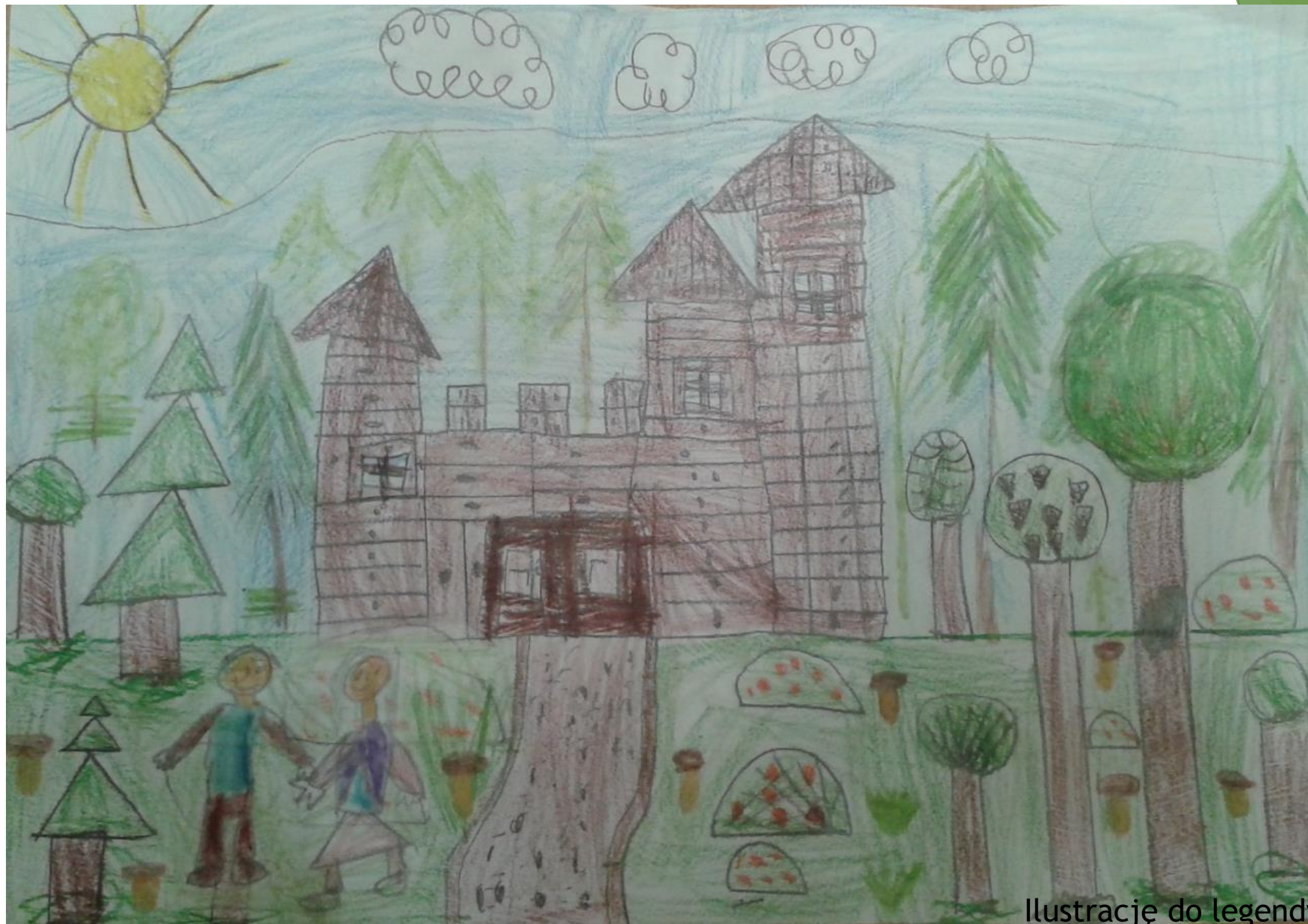
Ilustrację do legendy wykonał- Bartek