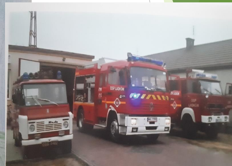
Wozy OSP Lasków