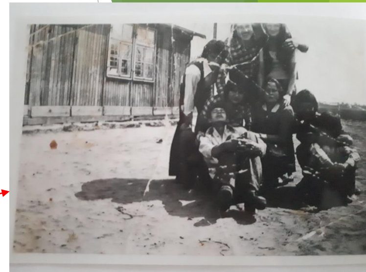
To nasi dziadkowie. W tle pierwsza remiza strażacka.