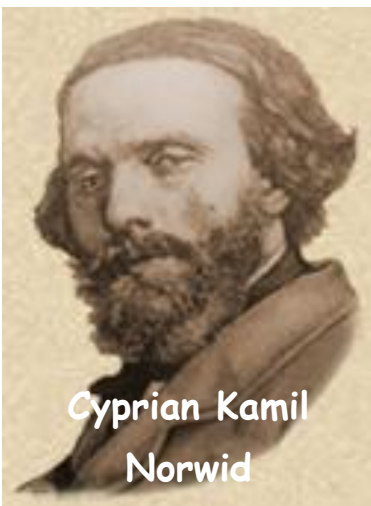
Cyprian Kamil Norwid