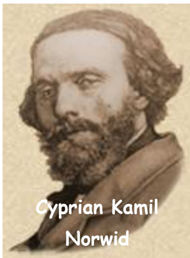
Cyprian Kamil Norwid