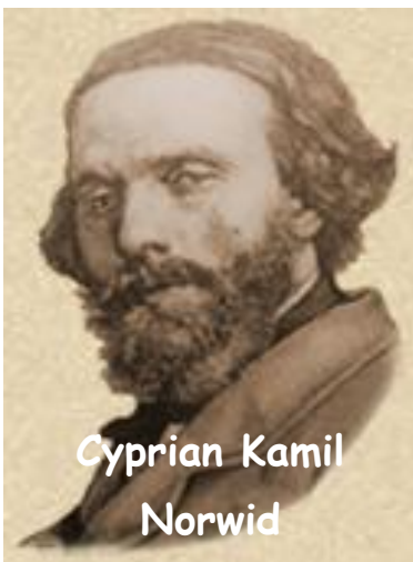
Cyprian Kamil Norwid