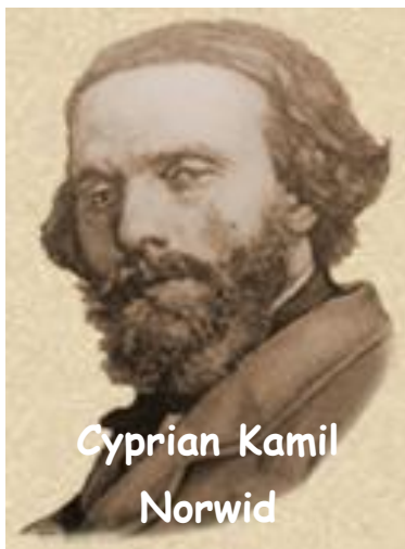
Cyprian Kamil Norwid